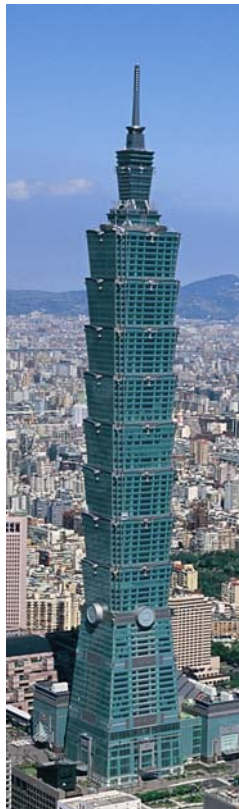
台北 101 大樓

台北 101 大樓規劃初期，既有地質文獻顯示基地南側有存疑性活動斷層-台北斷層-通過，受業主委託，陳博士以積極、負責、勇於任事的態度，邀集國內地質、大地工程產官學界的專家學者，規劃進行詳細的地質鑽探調查、試驗及論證，最後證實台北斷層於工程上屬非活動斷層，並確認 101 基地位於斷層擾動帶以外，解除各界的疑慮，為台北 101 大樓的規劃興建奠定基石。