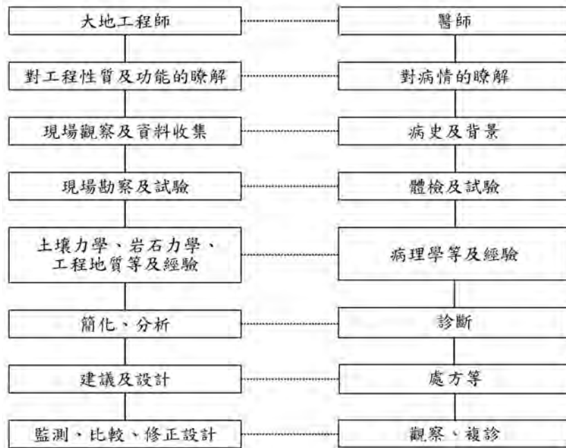
圖四 大地工程師與醫師的比較

接參加大地技師的考試，比一個專科醫師的證照所需的時間差了六、七年之多，且考試也偏重學科而缺乏對實務經驗的要求。