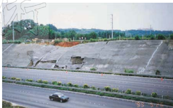
(a) 施工階段 (國工局, 1995)

本區為砂泥岩互層，受柑子崎向斜軸之影響，為一順向坡。由於豪雨造成崩積土沿泥岩層之平面滑動。整治以土牆及加強排水處理。