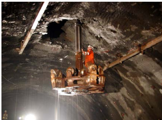
圖四 2003年2月8日一號豎井排氣井 RBM 擴孔鑽頭安裝

岩體為砂岩與砂質頁岩，隧道大致垂直岩層走向，並通過大橫屏山向斜及水流東斷層。國姓二號隧道最大覆蓋層為110m，主要為硬頁岩偶夾薄層砂岩，24k+354通過北山坑向斜軸部，24k+300附近有一寬20m之破碎帶。埔里隧道最大覆蓋層為110m，主要岩性為石英砂岩、炭質頁岩與礫岩，通過觀音山向斜及觀音橋背斜，褶皺軸部之岩體破碎。設計採 RMR 岩體分類法，以鑽炸法與