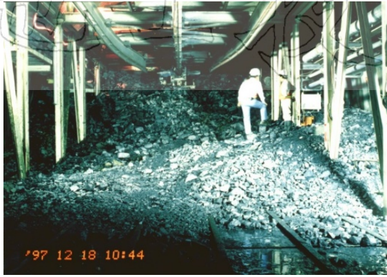
圖二 雪山隧道主坑西行線 38k+902 坍方