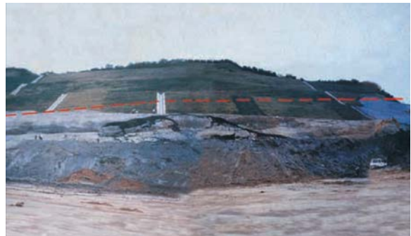
(a) 施工階段 (國工局)

為六階開挖邊坡，地質上為上新世卓蘭層砂泥岩互層。邊坡由上往下開挖至第2及3階時，因連日大雨導致邊坡坍滑，範圍長10至12公尺，寬約50公尺，深度約2至5公尺，主要為砂泥岩互層平面滑動。工程上以排樁、地錨、蛇籠及噴凝土處理。此處邊坡於施工階段及現況詳圖五。