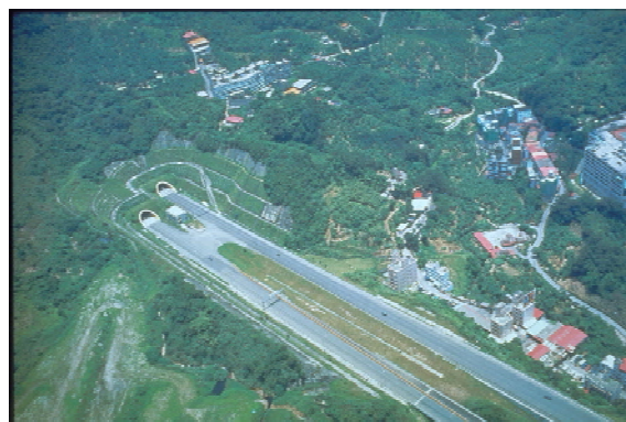
圖一 北二高福德隧道北口

隧道路線自研究院路四段四分子溪右岸以南偏西約 40°之方向穿越南港層與深坑間之陵線，至福德坑掩埋場東側山谷以南接木柵交流道。隧道路線通過南港層及大寮層，屬中新世，其間有成福斷層及其擾動帶經過，施工採新奧工法，以鑽炸方式開挖。