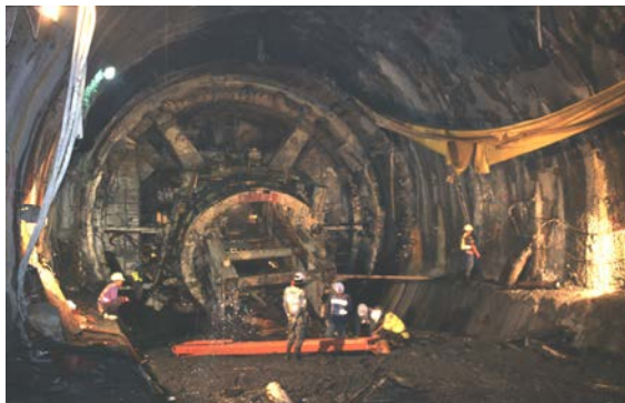
圖三 雪山隧道西行線 TBM38K+902.5 災變清理至機頭