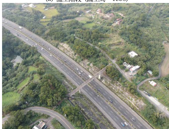
(b) 現況