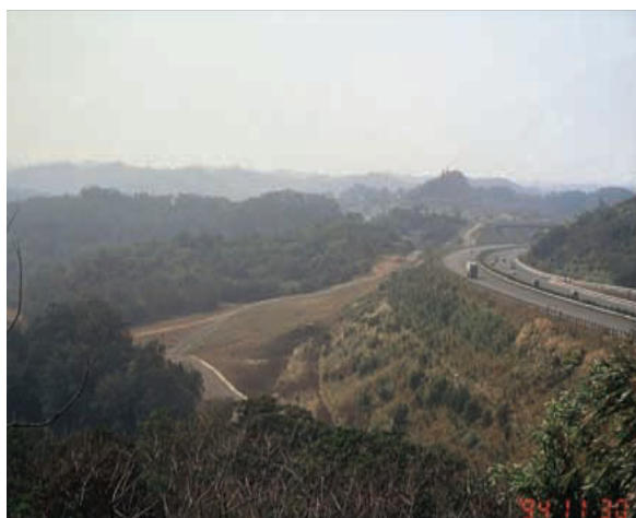
圖八 國道 3 號逆向 96k+600~97k+350 (國工局, 2013)