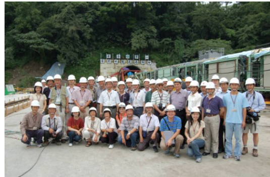
照片四 活動與會人員合照(曾文越域引水工程東隧道)