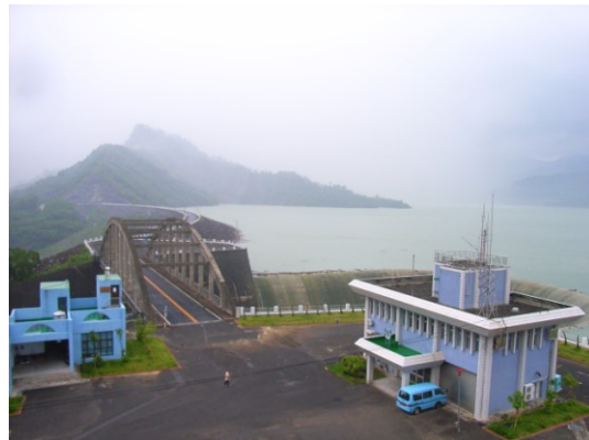
照片五 南化水庫大壩及溢洪道