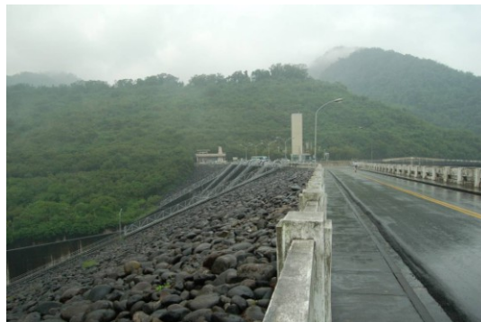
照片六 曾文水庫大壩