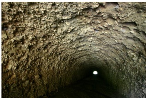
照片二 自立性良好，不需襯砌之礫岩隧道