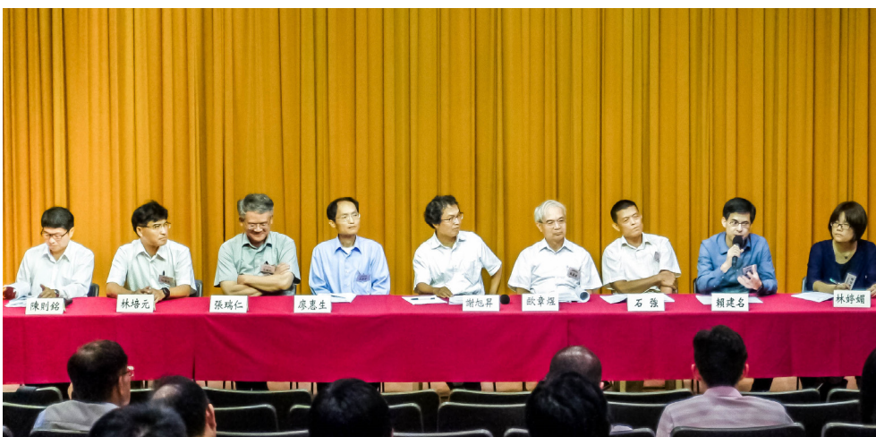
圖二 主講人與主持人Q&A